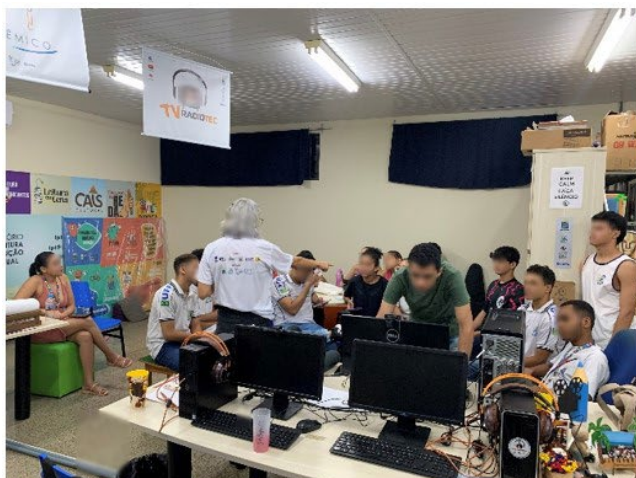
Figuras 1 a 4: Construção do roteiro do episódio do podcast.

híbrida: presencialmente no Colégio Técnico de Floriano e de forma online na plataforma Google Meet). No entanto, devido ao tempo limitado, estendemos a proposta para tornar possível a produção do episódio. Trabalhamos outras seis horas com o grupo de bolsistas e colaboradores do LPT (ver Figuras 1 a 4) e, posteriormente, a distância, para feedback, resultando na gravação de um episódio para o podcast do Colmeia Linguística, com a duração de oito minutos e dezessete segundos, objeto de análise deste trabalho.