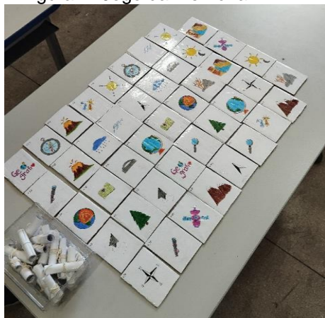
Figura 1- Jogo da Memória

Nessa prerrogativa as ilustrações das cartas do jogo (figura 1 e 2), foram feitas à mão livre buscando despertar um maior interesse dos estudantes com a dinâmica, além do mais permitir conhecer simbologias retratadas nos conteúdos e desmitificar a ideia de que Geografia é apenas decorar países.