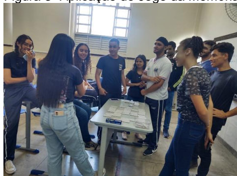
Figura 3- Aplicação do Jogo da Memória

Ademais, a necessidade da prática do pensamento crítico ressaltando que é primordial na disciplina de Geografia destarte, o jogo elaborado potencializa provocar reflexão crítica sobre assuntos trabalhados em sala de aula, como ilustrado pelas figuras 3 e 4.