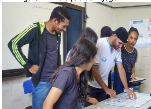
Figura 4-Interação com jogo