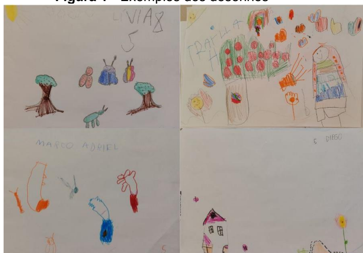
Fonte: Produção artística de: Livia; Thaylla; Marco Adriel; Diego.

Das 34 crianças, 22 desenharam a flora por meio de flores, gramas, árvores, plantas, e um pé de maçã, ou até mesmo “pé de pau” (Infográfico 1). Assim demonstram que algumas crianças além de trazerem elementos da flora, especificou qual planta seria. Sobre a fauna 25 crianças escolheram representar nos desenhos joaninha, borboletas, grilo, coelho (Infográfico 1). No contexto do grilo, por exemplo, ele encontra-se pulando no mato. Já a formiga em cima de um monte, o qual, disse ser um formigueiro. Chama-se atenção ao observar os desenhos e as descrições das crianças que os animais (fauna) não foram postos “soltos” no cenário, mas demonstrando seu nicho e habitat conforme é visto no cotidiano ecológico.