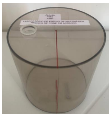
Figura 1 –Cilindro utilizado

Depois de entender os conceitos básicos, passamos para a parte prática da oficina. Conforme ministrava os conteúdos, utilizamos esses materiais para exploramos a origem e o desenvolvimento das fórmulas matemáticas de forma a ajudar os alunos a entenderem seu propósito e significado. Explicamos, por exemplo, que o cubo é um sólido geométrico cujas dimensões possuem medidas iguais e a fórmula surge da compreensão de que o volume de um cubo é dado pela medida do comprimento multiplicado por si mesmo três vezes, ou seja, uma de suas arestas elevada ao cubo.