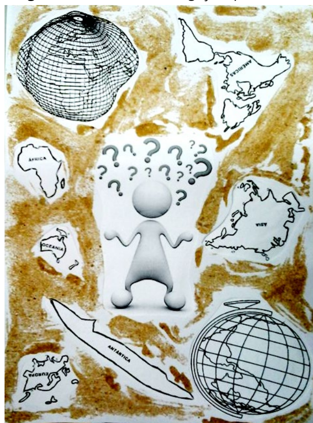
Imagem 1 - Carta de tarô. Indagações produzidas.

cadas por cores, formas, nuances, traçados que são diversos, nas cartas de tarô, é uma aposta na potência de produção de pensamento que emerge no interstício entre as histórias de uns [personagens], potência que transforma, que muda, se desloca, gera distância e o pôr-se na exterioridade da relação pesquisador/a em formação e seu projeto de pesquisa, para pensá-la, essa relação, de um outro lugar.