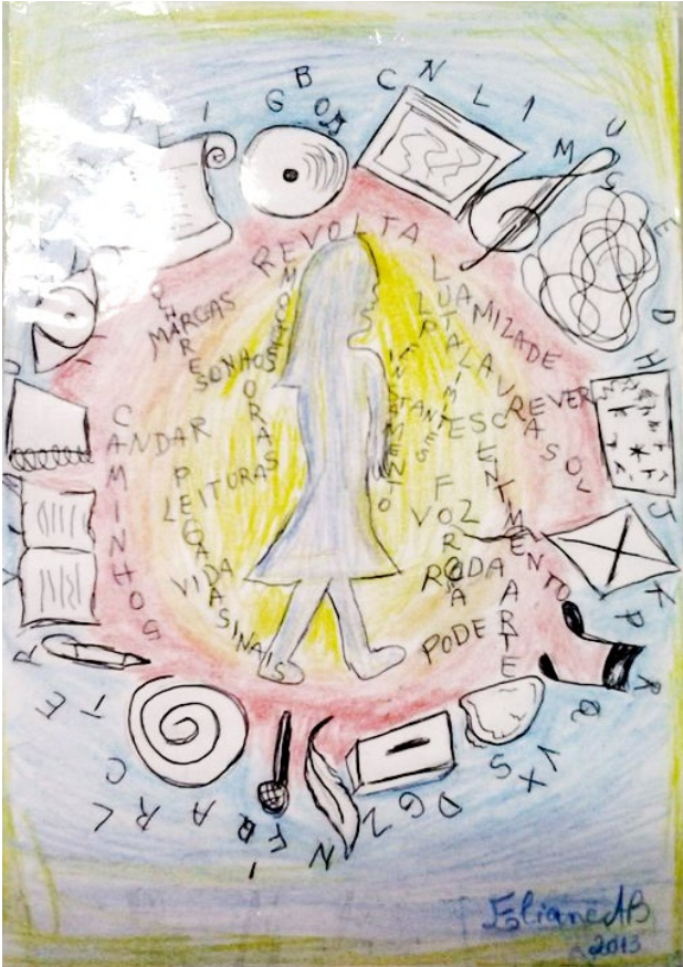
Imagem 3 - Carta de tarô. Roda como abertura ...

Por isso, o que unifica os dois mundos é o evento único do ato singular, participativa, não indiferente (Ponzio, 2010, p. 21).