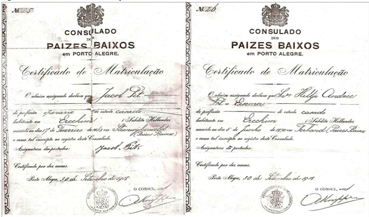
Figura 3 - Certificado de Matriculação de Jacob e Hiltze Pit.