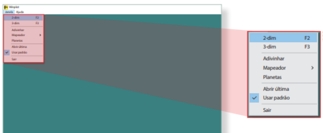
Figura 1: O Winplot Sendo Aberto (LIVRO DIDÁTICO, 2022, p.138).

A Figura 1 mostra como é o programa após a sua abertura e dá as coordenadas para a utilização e manuseio do mesmo.