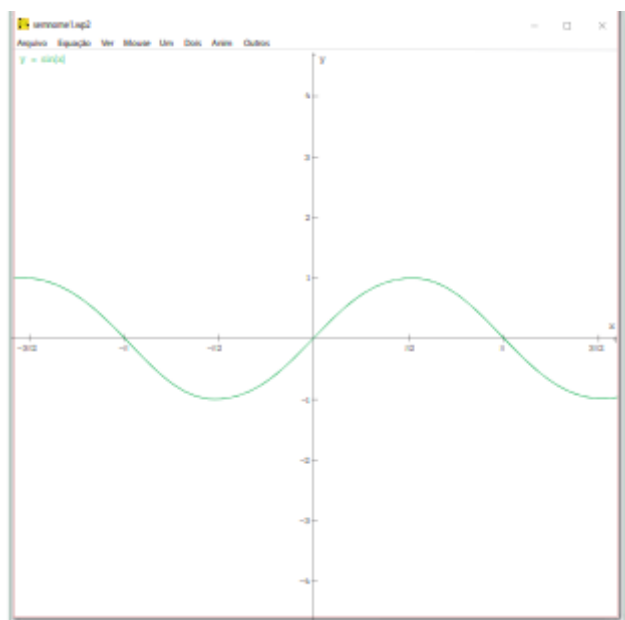
Figura 3: Gráfico Final da Função Seno (LIVRO DIDÁTICO, 2022, p.139).

No livro didático, a demonstração da função seno no Winplot é finalizada com apresentação do gráfico da função, a sequência de imagens recursos de informação e comunicação impactarão na atenção, resulta-se em reflexos na aprendizagem (RIVERO, 2012). Logo, a relação entre tecnologias digitais e atenção permeia se pelo campo educacional, na Figura 3 é discorrida.