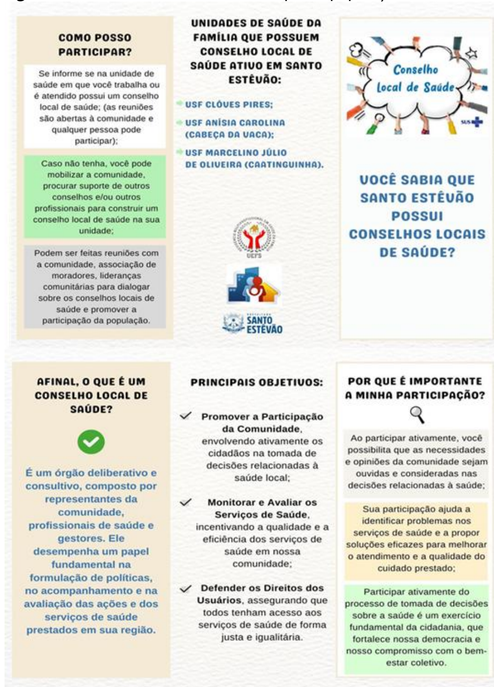
Figura 2: Folheto informativo distribuído para a população sobre Conselhos Locais de Saúde.

que dificultou o processo de aceitação. Foram realizadas exposições orais sobre a importância e as funções do CLS em salas de espera da unidade, em grupos operativos e em quaisquer outros ambientes oportunos, para isso, utilizou-se alguns materiais informativos como representado na Figura 2. Os Agentes Comunitários de Saúde (ACS) engajaram-se e comprometeram-se com o processo, visando assegurar que cada microárea do território fosse representada por pelo menos um usuário.