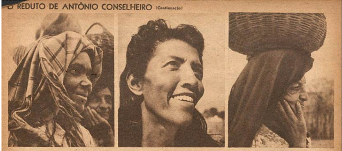
Figura 02. As três mulheres.